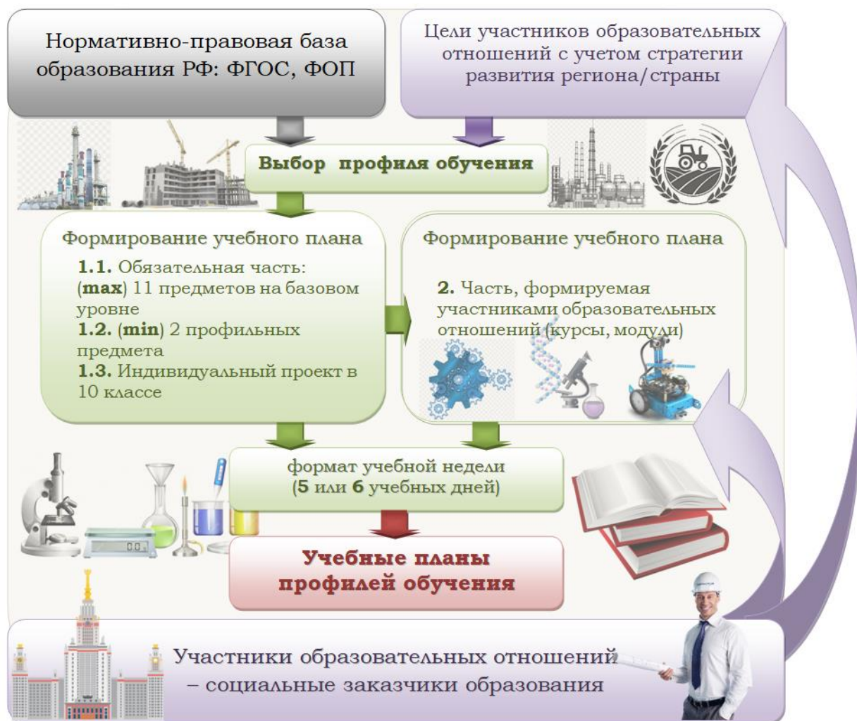
Рис. 1 – Организационно-содержательная модель профильного обучения

Основаниями данной модели являются нормативно-правовой (ФГОС СОО, ФОП СОО) и целевой компоненты, которые учитывают стратегии развития региона, страны и системы образования в целом. С ними тесно связан личностный компонент, который отражает потребности участников образовательного процесса и социальных партнеров в получении качественного образования. Все три компонента системы влияют на содержание (содержательный компонент), которое представлено в виде обязательной части (обеспечивает достижение результатов среднего общего образования) и части, формируемой участниками образовательных отношений (обеспечивает инвариантный состав содержания, варианты профильной дифференциации, отражение региональной специфики) и организацию обучения (организационный компонент), предусматривающую