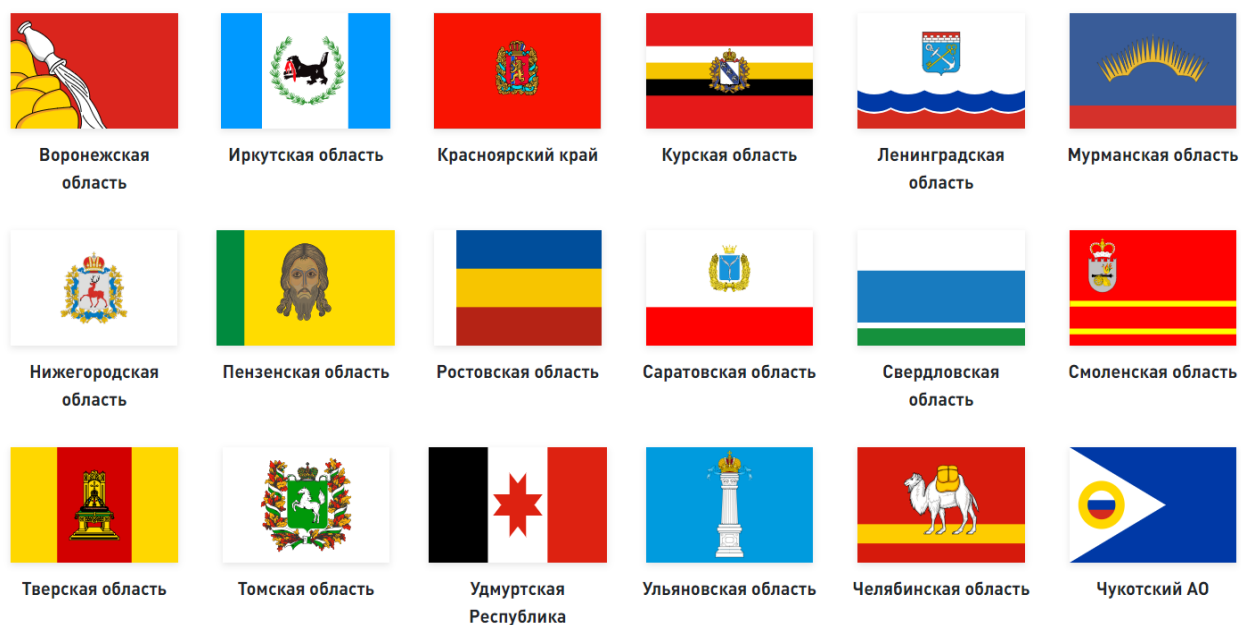
Рис.4 – Субъекты РФ, в которых работают «Школы Росатома»

этих конкурсов в качестве награды проходят стажировки в лучших образовательных организациях нашей страны 31 .