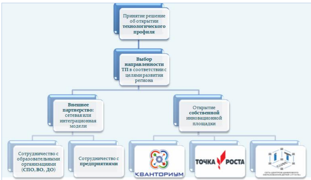
Рис. 3 – Алгоритм организации профильного обучения технологической (инженерной) направленности

Проведенный анализ деятельности образовательных организаций среднего общего образования позволил разработать алгоритм организации профильного обучения технологической (инженерной) направленности, который представлен на рисунке 3.